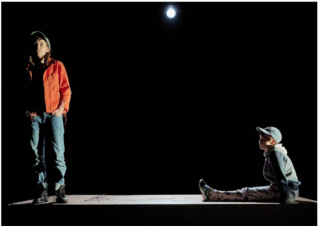
@Christophe Raynaud de Lage