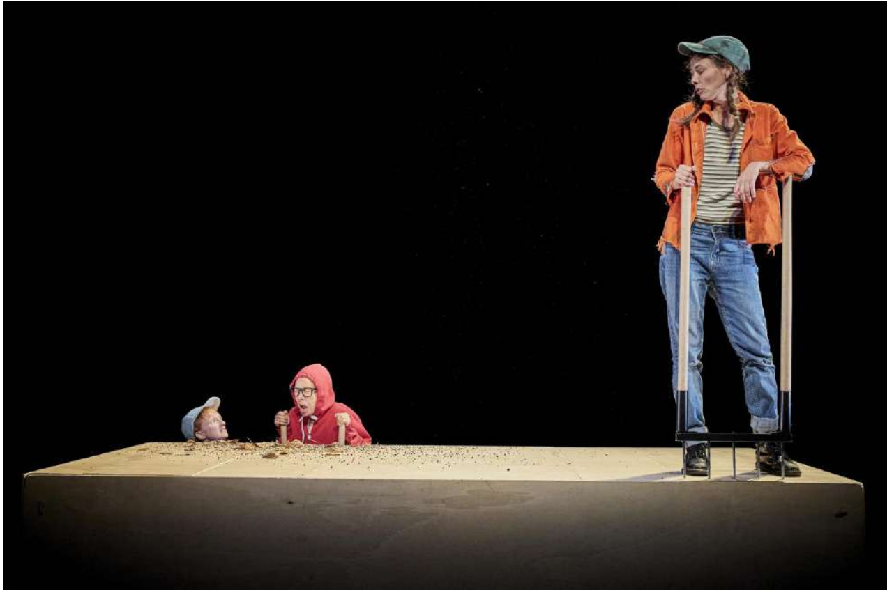
@Christophe Raynaud de Lage